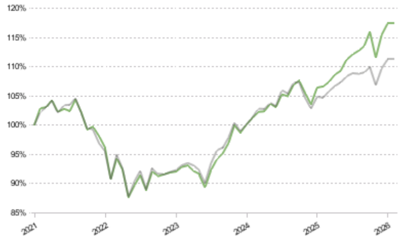
FCT 1e 45 Global Pictet LPP 2005 40 Plus TR CHF