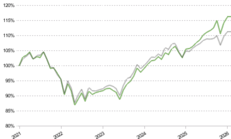
FCT 1e 45 Sustainable Pictet LPP 2005 40 Plus TR CHF