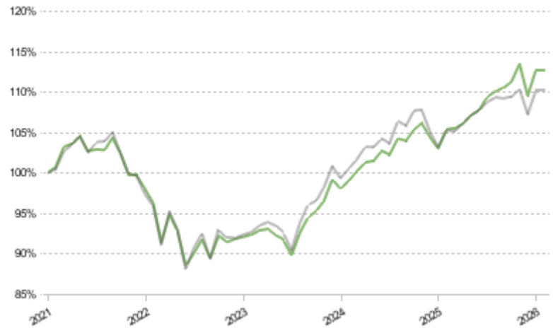
FCT 1e 35 Global Pictet LPP 2005 40 Plus TR CHF