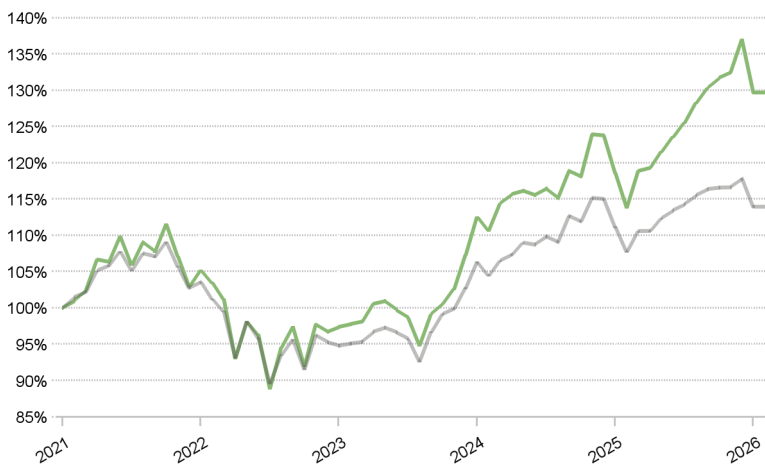
FCT 1e 100 Global Pictet LPP 2005 60 Plus TR CHF