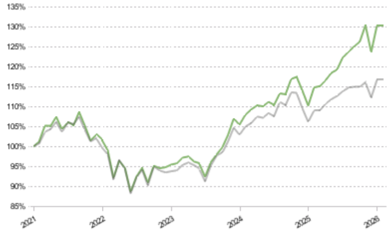
FCT 1e 75 Global Pictet LPP 2005 60 Plus TR CHF