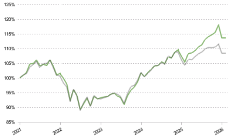
FCT 1e 45 Global Pictet LPP 2005 40 Plus TR CHF