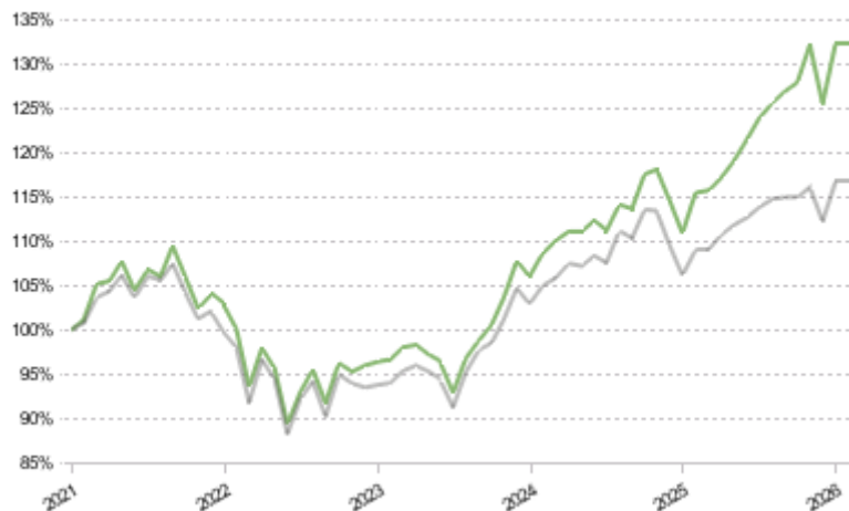
FCT 1e 75 Sustainable Pictet LPP 2005 60 Plus TR CHF