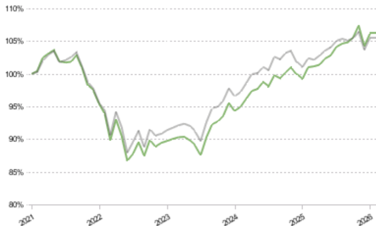
FCT 1e 25 Sustainable Pictet LPP 2005 25 Plus TR CHF