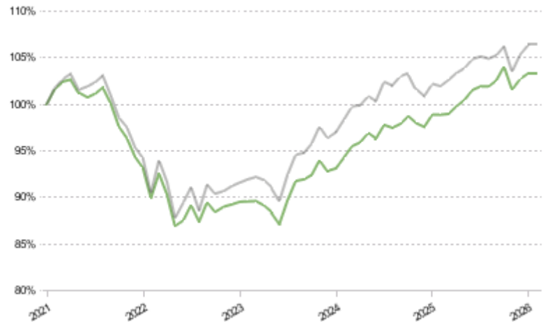
FCT 1e 15 Sustainable Pictet LPP 2005 25 Plus TR CHF