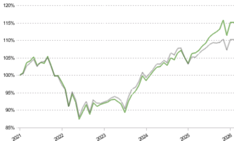
FCT 1e 45 Sustainable Pictet LPP 2005 40 Plus TR CHF