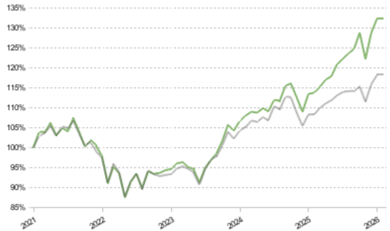
FCT 1e 75 Global Pictet LPP 2005 60 Plus TR CHF